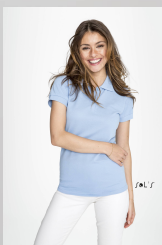
PRIME WOMEN 00573